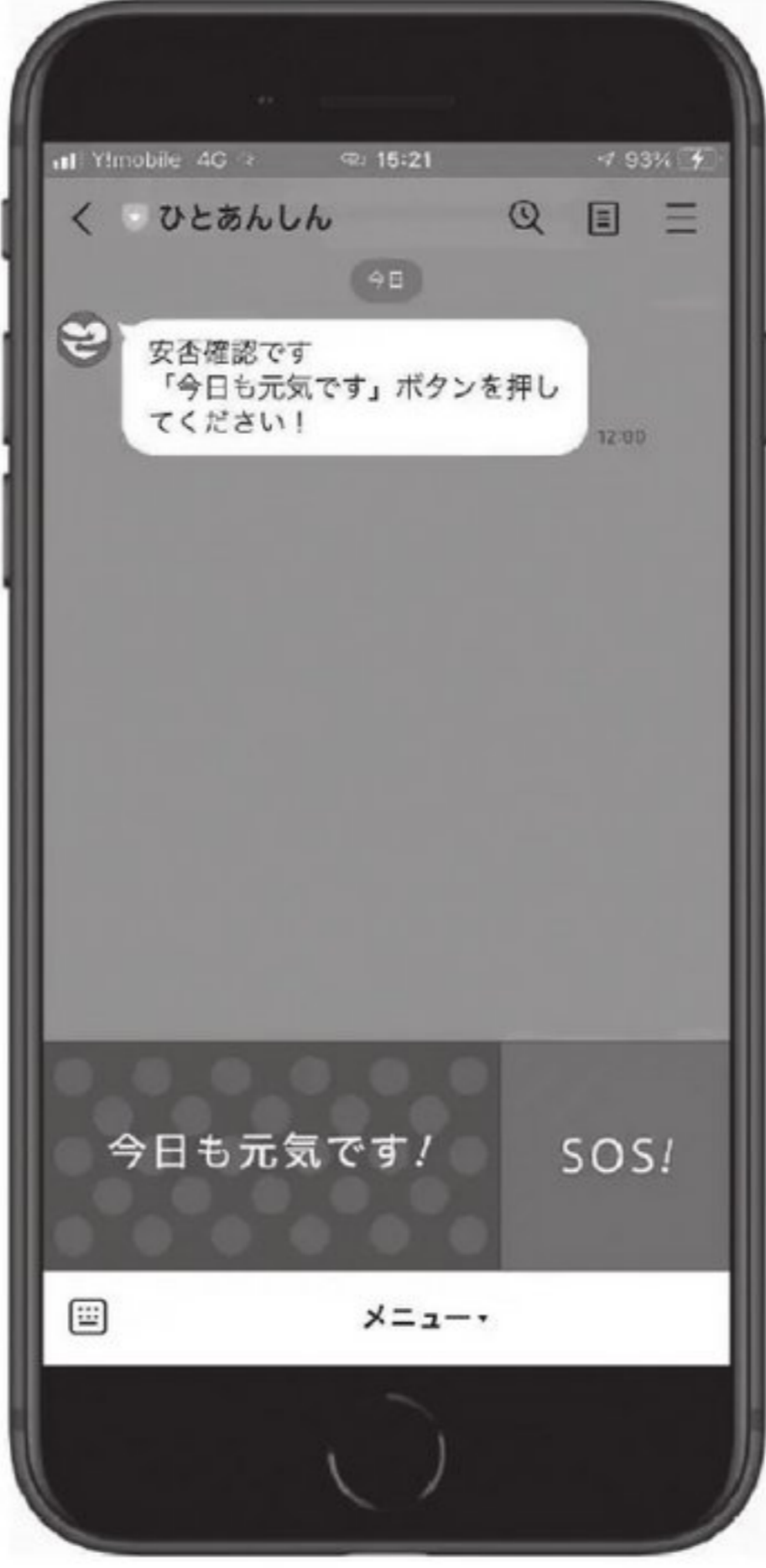
▲安否確認画面のイメージ