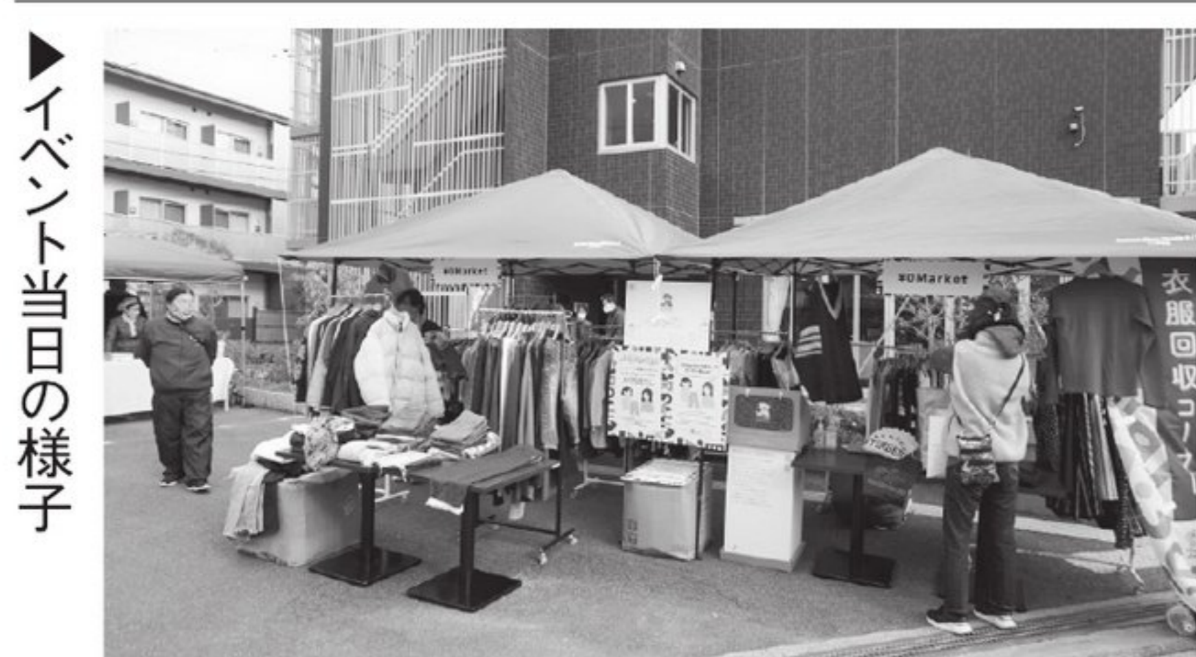
会場となったサ高住