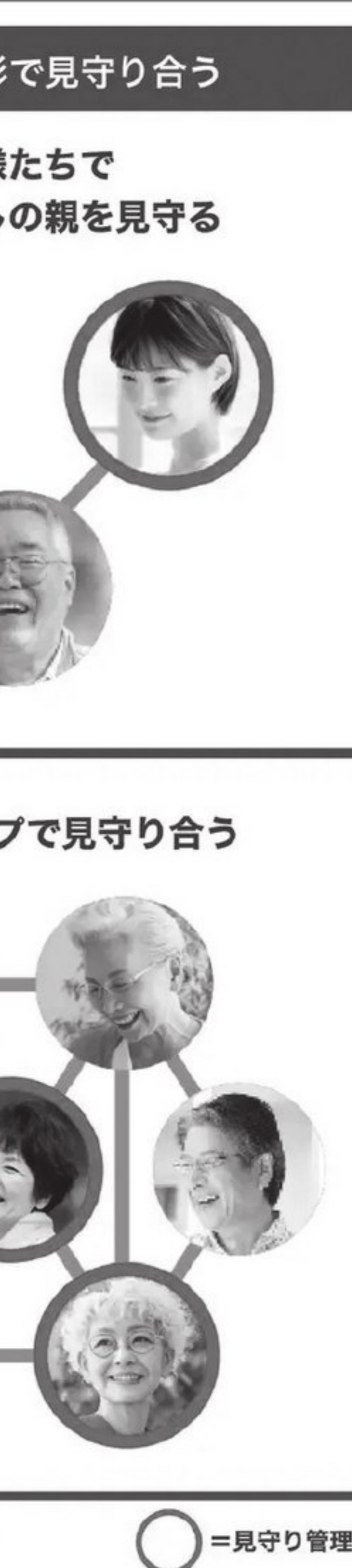
▲見守りのイメージ図 ○=見守り管理者

ボタンを押すと、それが管理者に通知される仕組み。ボタンを押していないメンバーに対しては、毎日12時と14時に「ボタンを押してください」の安否確認メッセージが届く。