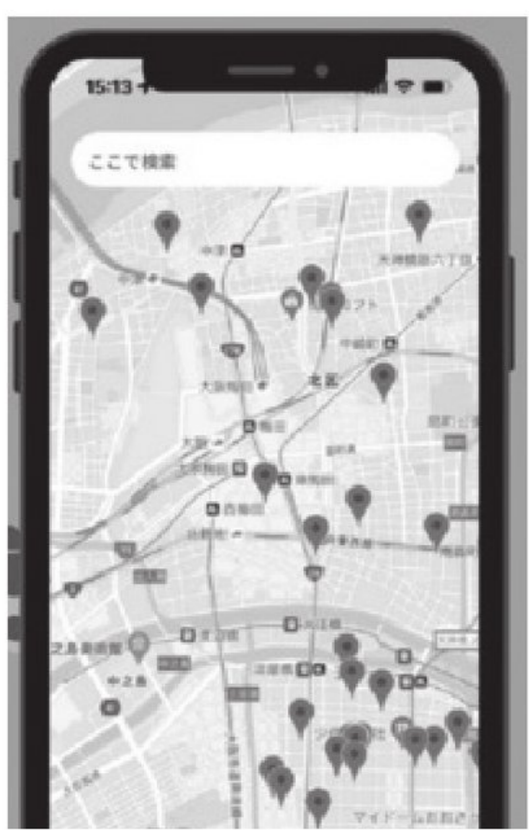
▲検索結果のイメージ

高齢者住宅検索サイトの運営や入居相談事業、介護に携わる人たちのオンラインサロン運営を手がけるシニアnet介護(大阪市)は、現在地から介護事業所を検索できるアプリ「シニアnet介護」の提供を先月