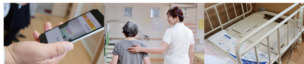
グループ会社が培った介護ノウハウと様々なICT製品を活用し、介護業界のDX化を促進させるサービスコンテンツを展開。