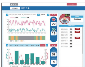
アンシエルで想定した利用者様のデータ。