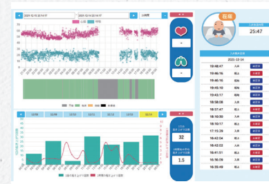
アンシエルで測定した利用者様のデータ。