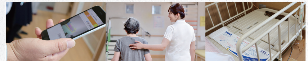
グループ会社が培った介護ノウハウと様々なICT製品を活用し、介護業界のDX化を促進させるサービスコンテンツを展開。